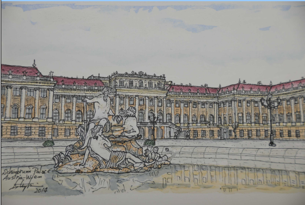
シェーンブルン宮殿正面を描いています。

・シェーンブルン宮殿は、ウィーン市中心部シュテファン大聖堂から西に直線で約5kmの位置にある。市内からは地下鉄U4号線に乗りシェーンブルン駅下車。庭園は東西約1.2km、南北約1kmの規模で、1779年頃から公開されている。建物は、あらゆる部屋を合計すると1,441室あり、両翼の端から端まで180mあり、正面右側翼には宮廷劇場がある。また、広いフランス式庭園を挟んで宮殿に向かい合う丘の上にはグロリエッテという対プロイセン戦の勝利と戦没者の慰霊の為に立てたギリシャ建築の記念碑(未完成)があり、ここからは周囲が一望できる。オーストリアで一番重要な観光資源で、年間入場数150万人。更に公園と動物園や行事での集客数520万人を合計すると年間には670万人が訪れる。外壁は金を塗ろうとしたところ、マリア・テレジアが財政の状況を考慮し、黄金に近い黄色にした、これをテレジア・イエローと云うが、彼女が好んでいた色というわけではない。