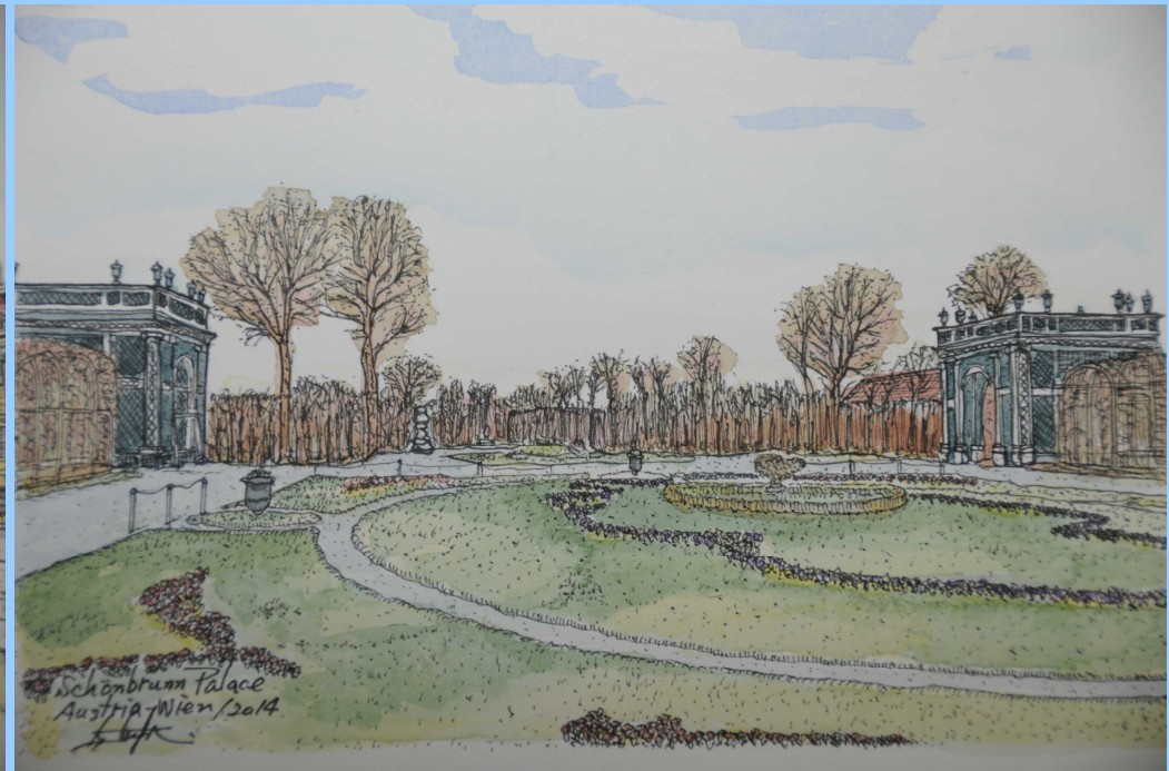
シェーンブルン宮殿の裏側の庭園を描いています。