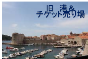
旧港 & チゲット売り場