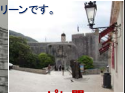
ピレ門 バス乗降所