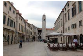
←メインストリートにはお土産屋さんが沢山あります