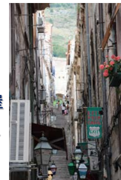
←メインストリート～ブジャ門～ロープウェイ乗り場へ行く通路です。