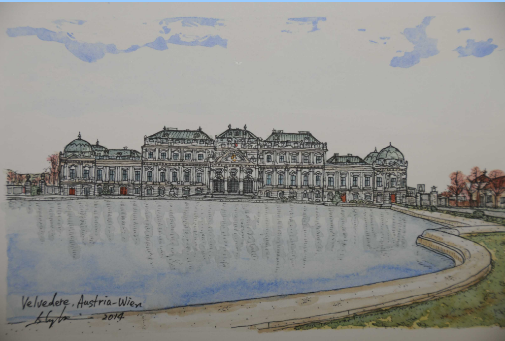
ベルヴェデーレ宮殿正面を描いています。

もともとハプスブルク家に仕えたプリンツ・オイゲンが、当時の代表的な建築家であるヨハン・ルーカス・フォン・ヒルデブラントに、夏の離宮として造らせたものである。1714から1716年にかけて下宮(Unteres Belvedere)、1720から1723年にかけて上宮(Oberes Belvedere)が建設された。プリンツ・オイゲンの死後1752年に、ハプスブルク家のマリア・テレジアに売却された。現在はオーストリア絵画館になっている。オーストリアで2番目に大きな美術館である。オーストリアの20セントユーロ硬貨の裏面には、門越しに見た宮殿が彫られている。また、この宮殿の構内に作曲家ブルックナーが晩年を過ごした邸宅がある。