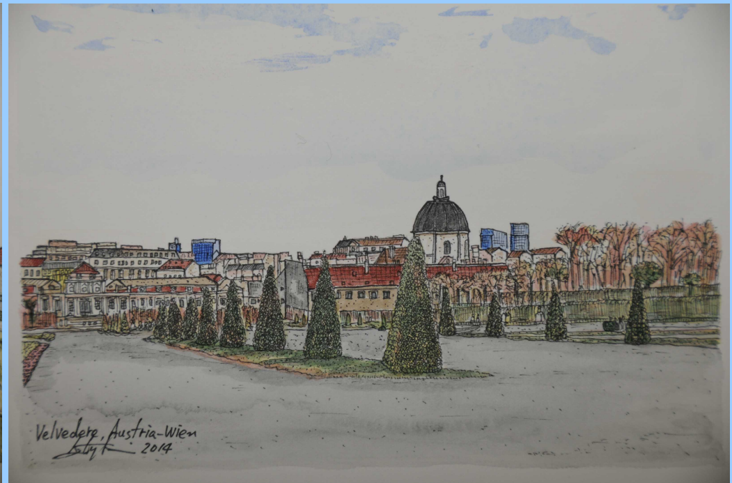
ベルヴェデーレ宮殿の裏側の庭園を描いています。